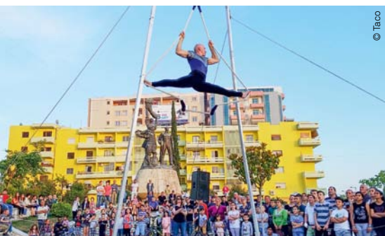
Taco, interkulturelle Kleinkunst

Aktuelle Berichte aus Bihac, Lesbos und der Schweiz